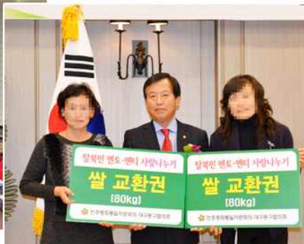
▲ 설맞이 북한이탈주민 사랑나누기(대구 동구협의회)