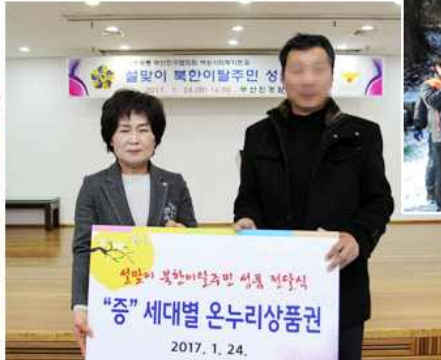
▲ 설맞이 북한이탈주민 상품 전달식(부산 부산진구협의회)