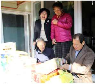
▲ 재일학도의용군 위로 방문(경남 합천군협의회)

부산 남구협의회(회장 박동천)는 1월 4일 부산사회복지공동모금회에 이웃돕기성금 4,000만원을 기탁했고, 전남 영광군협의회(회장 권재국)는 13일 '2017 희망나눔 성금기탁식'을 개최해 성금을 전달했으며, 전북 순창군협의회(회장 김성수)는 23일 동계면에 위치한 장애인 요양 시설을 방문해 설맞이 생필품을, 같은 날 대전 중구협의회(회장 한재득)는 관내 노인요양시설을 찾아 생필품을 전달했다.