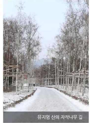
뮤지엄 산의 자작나무 길

콘크리트 내벽에 등을 대고 앉아, 차분히 겨울의 풍경을 바라보고 있다면, 한파를 핑계로 투덜댔던 것이 미안할 만큼 올라가는 계절이 아쉬워진다. 이 계절의 끝에 새 계절이 오고, 그리하여 다시 겨울이 찾아온다 해도 오늘의 이 겨울은 아닐 것을 알기 때문이다.