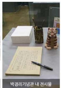
박경리기념관 내 전시물