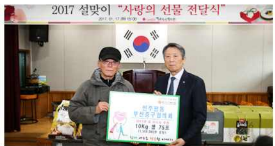
▲ 설맞이 사랑의 선물 전달식(부산 중구협의회)

부산 사하구협의회(회장 백백식)는 1월 16일 구청에서 대행기관장과 사하경찰서 관계자, 북한이탈주민 등과 함께 '설맞이 북한이탈주민 행복나눔 성품전달 및 간담회'를 개최했고, 같은 날 대구 동구협의회(회장 송진오)는 대구동부경찰서에서 북한이탈주민을 대상으로 '2017 설맞이 북한이탈주민 사랑나누기'를 행사를 열었다. 충북 옥천군협의회(회장 과국상)는 20일 북한이탈주민 지원센터 운영위원회의 및 설맞이 나눔 행사를, 부산 중구협의회(회장 임무성)는 17일 중구노인복지관에서 관내 소외계층 가정을 초청해 '설맞이 사랑의 선물 전달식'을 가졌다.