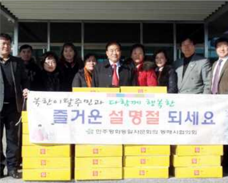
▲ 설명절 북한이탈주민 나눔행사(강원 동해시협의회)