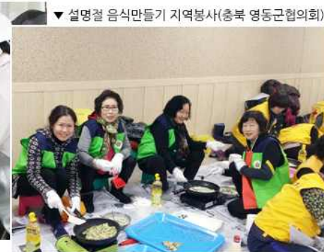
▼ 설명절 음식만들기 지역봉사(충북 영동군협의회)