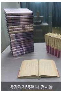
박경리기념관 내 전시물

파란만장한 한국 근·현대사 속에서 생존을 위해 고군분투했던 여러 계층의 이야기를 담아낸 대하소설 '토지'. 이제는 고인이 된 작가 박경리가 장장 25년에 걸쳐 집필한 토지의 마침표를 찍은 곳이 바로 원주이며 그래서 이곳에는 작가의 옛 집과 작가의 이름을 딴 문학공원이 자리하고 있다. 발을 일구고 글을 썼다는 작가의 소박한 일상이 그대로 묻어나듯 옛집과 문학공원 어느 쪽도 소박한 규모를 자랑한다. 그래도 '토지' 속 배경을 그대로 옮겨 놓은 3개의 테마 공원과 죽기 전 여생의 마지막을 보냈다는 옛 집에서는 친필 원고 등을 관람할 수 있어 한번쯤 둘러볼 만하다.