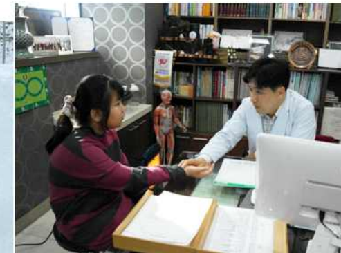
▲ 어깨동무하기 멘토링 : 멘티 한방의료진료 (경남 진주시협의회)