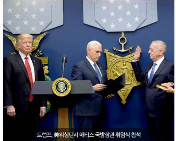
트럼프, 美워싱턴서 매트리스 국방장관 취임식 참석

세간에서는 국가안보회의가 스티브 배넌 수석 전략가, 토머스 보설트 국토안보보좌관, 마이클 폴린 국가안보보좌관과 함께 이념적으로 편향되어 있는 강경론자들이 이끌게 되었다는 점을 우려하고는 있지만, 최근의 행정명령 13767호가 유관 부처간 협의 없이 대통령 독단으로 처리되어 혼선을 빚는 지금의 상황을 고려해볼 때 국가안보회의가 정책 결정 과정에 있어 얼마나 유효할지는 미지수이다. 외교안보부처 실무진들이 자리를 채울 때까지 선거 기간 논란을 일으켰던 트럼프 대통령의 대외정책공약은 여과 없이 나타날 것으로 예측된다.