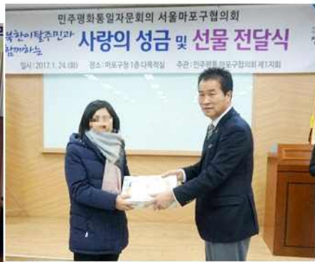
▲ 설맞이 북한이탈주민 사랑의 성금 및 선물 전달식 (서울 마포구협의회)