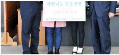
▲ 설맞이 북한이탈주민 사랑나눔 성품전달식 (부산 동래구협의회)