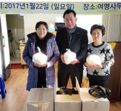
▲ 설명절 북한이탈주민 떡나눔 행사(충북지역회의)

강원 동해시협의회(회장 김홍수)는 1월 23일 동해경찰서에서 북한이탈주민 30세대와 설명절 북한이탈주민 나눔행사를 실시했고, 부산 부산진구협의회(회장 백옥자)는 24일 부산진구 여성사회복지분과위원회와 함께 부산진경찰서에서 북한이탈주민 20여 세대를 대상으로 '2017 설맞이 북한이탈주민 상품 전달식'을 가졌다. 강원 횡성군협의회(회장 조원용)는 24일 횡성경찰서, 보안협력위원회, 횡성청년회회소 등과 함께 조곡리에서 북한이탈주민 23명에게 설 선물을 증정했고, 전남 장성군협의회(회장 안숙자)는 25일 탈북민 가정을 방문해 식료품을 전달했다.