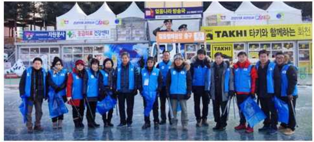
▲ 산천어축제장 환경정화활동(강원 화천군협의회)