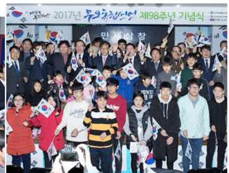
▲ 무오독립선언 98주년 기념식(선양협의회)