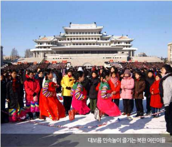
대보름 민속놀이 즐기는 북한 어린이들

1994년부터 시작된 북한의 '고난의 행군'은 돈 없고 권력 없는 사람들의 생명을 수 없이 앗아갔다. 그래서 정월대보름만큼은 한 끼를 배불리 먹고 신령님 품으로 가겠다는 의지를 다지며 맹물을 떠놓고 '새해에는 제발 우리의 생명을 보존케 해달라'고 비는 사람들이 많았다. 즉 북에서 정월대보름이 재탄생한 이유는 경기가 불안한 남한 사회에 로또 구매자수가 늘어나는 현상과 비슷하다고 볼 수 있다. 국가가 배급을 못하고 생존의 불확실성이 커가자 김정일도 태도를 바꿔 정권을 탓하지 말고 하나님이나 신령님을 탓하라는 의도로 정월대보름을 부활시킨 셈이다.