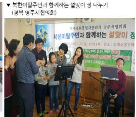
▼ 북한이탈주민과 함께하는 설맞이 경 나누기 (경북 영주시협의회)