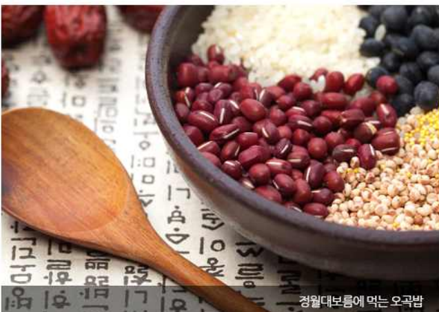
정월대보름에 먹는 오곡밥

북에서는 정월대보름날 아침에 오곡밥과 아홉 가지 나물, 귀밝이술을 한 잔씩 즐겨 먹는다. 오곡밥은 신체의 오장을 든든하게 하고, 아홉 가지 나물은 90세까지 건강하게 장수하라는 뜻이며, 귀밝이술은 한 해 동안 귀를 밝게 해준다는 의미이다. 때문에 이날만큼은 주부들이 어떻게든 대보름 음식상을 보는 풍습이 있다. 음식상은 계층별로 천차만별이다. 권력층은 승용차에 잘 삶은 돼지머리와 고급 양주, 남방 과일 등을 싣고 풍수지리가 좋은 장소에 가서 건강과 진급을 바라는 소원을 빈다. 간부가 직접 나가기보다는 아내나 자식들이 대신하는 것이 보편적이다. 간부들이 직접 나서면 오히려 불이익을 당한다는 것을 잘 알고 있기 때문이다. 부유층은 재산을 지켜주고 잡혀가지 않기를, 중산층은 한 해 동안 불법을 들키지 않고 돈을 많이 벌게 해달라고 빈다. 가족이나 친척, 가까운 지인이 정월대보름 전에 사망했을 때는 망자의 명복을 빌기보다 죽은 사람이 자기들에게 다가올 불행을 다 안고 가라는 비윤리적인 소원을 빌기도 한다.