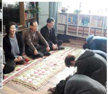
▲ 명절맞이 탈북청소년 생활공동체 '우리집'방문 (경기 과천시협의회)

충남 예산군협의회(회장 정달순)는 지난 12월 30일 지역 탈북청소년들과 함께 청양 알프스마을로 문화체험을 다녀왔고, 경남 진주시협의회(회장 원호영)는 1월 11일 어깨동무하기 멘티 학생들을 대상으로 한방의료 진료를 실시했다. 경기 과천시협의회(회장 이순형)는 1월 26일 설 명절을 앞두고 과천시협의회가 멘토링해 왔던 안산시 탈북청소년 생활공동체 '우리집'을 방문해 아이들과 즐거운 시간을 보냈다.