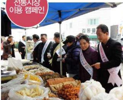
▲ 설맞이 전통시장 애용 캠페인 및 설 장보기(전북 익산시협의회)