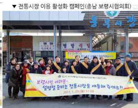
▼ 전통시장 이용 활성화 캠페인(충남 보령시협의회)