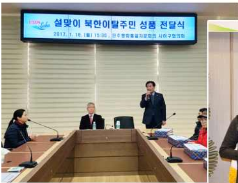
▲ 설맞이 북한이탈주민 행복나눔 성품전달 및 간담회 (부산 사하구협의회)