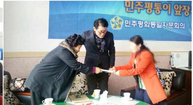
▲ 북한이탈주민 정착지원금 전달식(전남 함평군협의회)

전북 고창군협의회(회장 최석기)는 1월 15일 북한이탈주민들에게 성금을 전달하고 새해 맞이 행사를 열었으며, 전남 함평군협의회(회장 윤영수)는 25일 북한이탈주민들에게 정착지원금과 선물을 전달하는 시간을 가졌다.