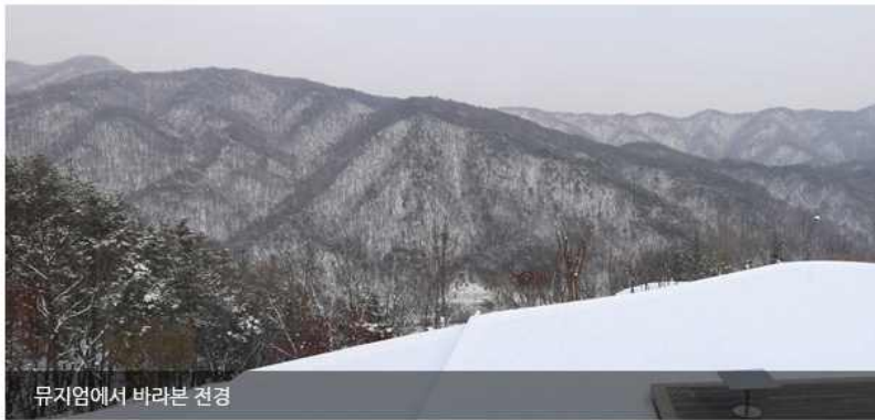
뮤지엄에서 바라본 전경