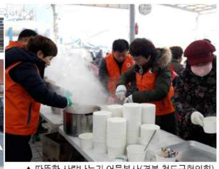
▲ 따뜻한 사랑나누기 어묵봉사(경북 청도군협의회)