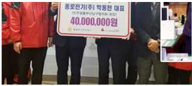
▲ 이웃돕기 성금 4000만원 기탁(부산 남구협의회)