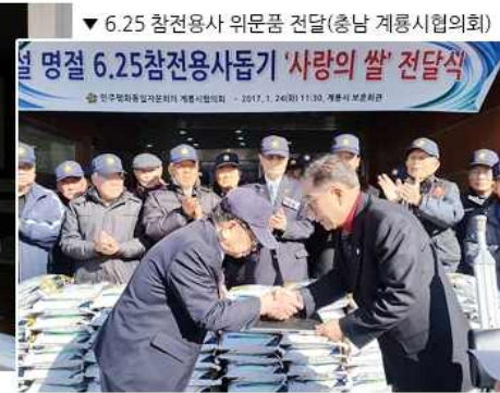
▼ 6.25 참전용사 위문품 전달(충남 계룡시협의회)