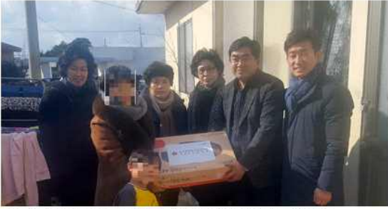
▲ 북한이탈주민 설맞이 격려물품 전달(제주 서귀포시협의회)

부산 해운대구협의회(회장 정현태)는 1월 23일 지역 북한이탈주민 141세대에 705만 원 상당의 온누리상품권과 지역특산품을 전달했고, 경기 김포시협의회(회장 최선희)는 21일 김포경찰서와 함께 지역 북한이탈주민에게 떡국 떡을 선물했다. 경북 영주시협의회(회장 정주현)는 22일 '북한이탈주민과 함께하는 설맞이 정 나누기' 행사를 개최했고, 제주 서귀포시협의회(회장 이경용) 여성분과위원회(위원장 양춘열)는 20일 지역 북한이탈주민 가정에 과일과 식료품 등을 전달했다.