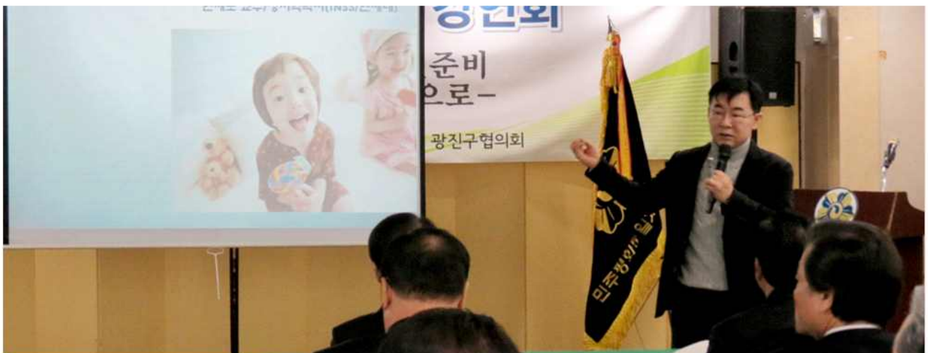
▲ 신년 통일안보 강연회(서울 광진구협의회)