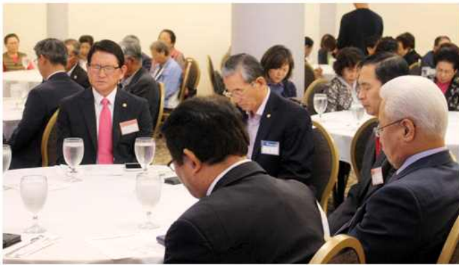
▲ 민주평화통일기원 조찬기도회 및 신년하례식(하와이협의회)