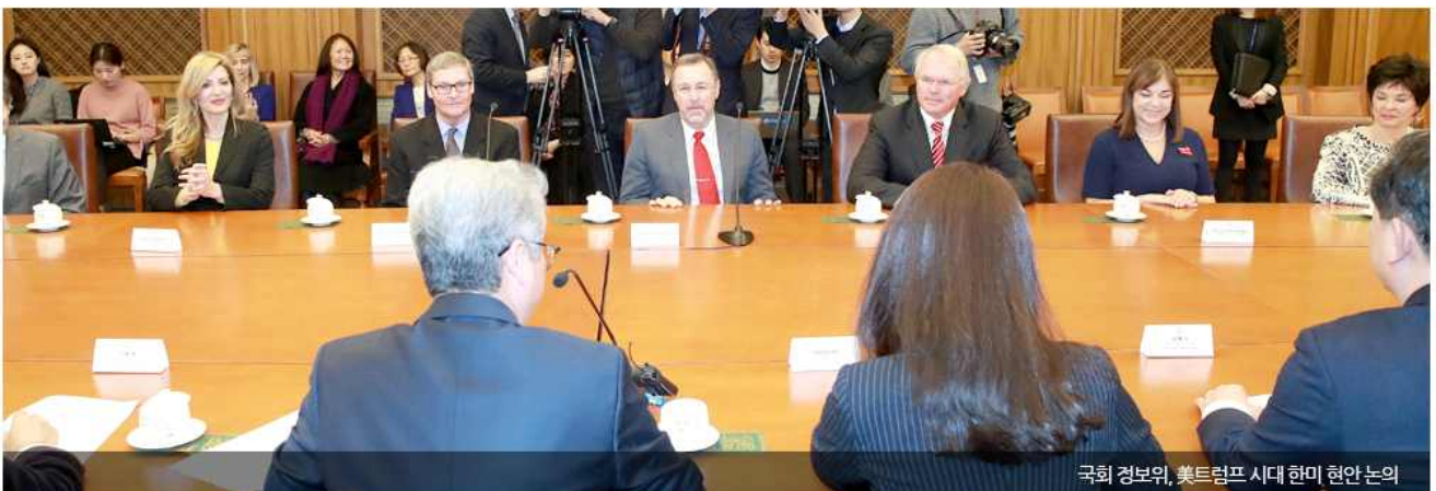
국회 경보위, 美트럼프 시대 한미 현안 논의

이러한 맥락 속에 한반도 문제에 대한 트럼프의 접근법이 존재한다. 트럼프 대통령의 북핵문제에 대한 접근법은 중국역할론이다. 중국이 북한의 비핵화를 위해 압박해야 하고, 미국은 이러한 중국을 압박해야 한다는 것이다. 물론 미중간 '무역전쟁'과 미국의 상업적 이익을 침해하는 남중국해 문제가 아시아에서의 우선순 위라는 점을 트럼프뿐만 아니라 마이클 폴린 국가안보보좌관, K.T. 맥퍼랜드 부보좌관 등에 의해 광범위하게 공유되고 있기는 하나, 최근 북한의 대륙간탄도 미사일 발사 징후와 북한의 핵능력 고도화로 인해 고조된 위협인식이 트럼프 대통령에게 전달되고 있다. 트럼프 대통령은 '미국의 적에게는 강하게 대응한다'는 입장을 표명해왔고, 최근 상원 외교위원회에서 밥 코커 의원은 북한의 정권교체나 비동적 수단의 유용성을 언급한 바 있으며, 이러한 공세적 접근법은 마이크 폼페오 국가정보국 국장과 마이클 폴린 국가안보보좌관과도 공유되고 있다. 요컨대 트럼프의 북핵 문제에 대한 입장은 '이전 행정부들의 대북정책은 실패했다'는 판단 하에, 비핵화의 의지가 없는 북한을 중국을 통해 압박한다는 데 있다. 중국에 대한 경제적·군사적 압박뿐만 아니라, '하나의 중국'과 같은 원칙을 협상 대상으로 삼는 거래주의적 접근법도 간과하지 않을 것으로 예측된다. 물론 김정은은 트럼프 대통령과의 대화와 협상을 원할 것이나, 트럼프 대통령은 이에 응하더라도 '햄버거를 대접하겠다'고 말할 만큼 김정은을 동등한 대화 상대로 취급할 가능성은 희박하다. 요컨대 트럼프의 대북접근법은 아직까지 명확히 제시되지 않았으나, 한반도에 있어서의 한미동맹 유지와 북한 비핵화라는 전략적 목적은 유지될 것이다. 다만 그 대북접근법과 추진 로드맵은 '전략적 인내'로부터의 차별성을 이끌어내고자 할 것이다.