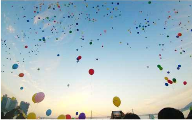
▲ 정유년(丁酉) 해맞이 평화통일염원 풍선 날리기(부산 수영구협의회)

서울 광진구협의회(회장 최복수)는 1월 23일 북한이탈주민, 보호단체 회원 등과 함께 북한 북한전문가를 초청해 '신년 통일안보 강연회'를 개최했다.