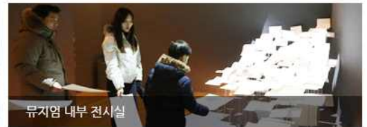
뮤지엄 내부 전시실