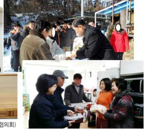
▲ 설맞이 탈북민 가정방문 물품 전달(전남 장성군협의회)

강원 동해시협의회(회장 김홍수)는 1월 23일 동해경찰서에서 북한이탈주민 30세대와 설명절 북한이탈주민 나눔행사를 실시했고, 부산 부산진구협의회(회장 백옥자)는 24일 부산진구 여성사회복지분과위원회와 함께 부산진경찰서에서 북한이탈주민 20여 세대를 대상으로 '2017 설맞이 북한이탈주민 상품 전달식'을 가졌다. 강원 횡성군협의회(회장 조원용)는 24일 횡성경찰서, 보안협력위원회, 횡성청년회회소 등과 함께 조곡리에서 북한이탈주민 23명에게 설 선물을 증정했고, 전남 장성군협의회(회장 안숙자)는 25일 탈북민 가정을 방문해 식료품을 전달했다.