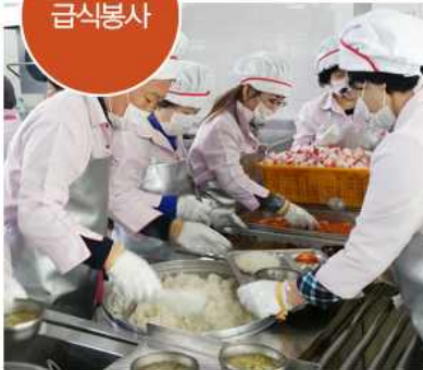
▲ 정유년 첫 급식봉사(대구 달성군협의회)