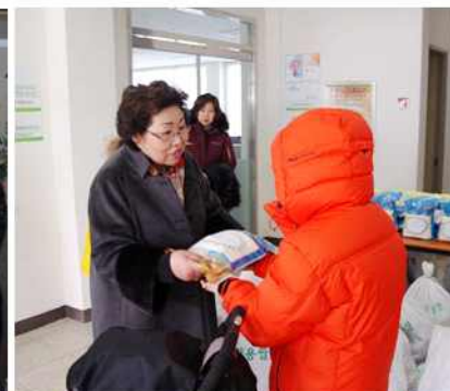
▲ 설맞이 북한이탈주민 떡국 떡 나눔행사 (경기 김포시협의회)