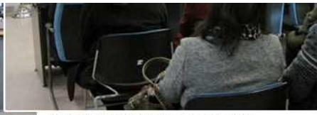
▲ 북한이탈주민 명절 위문 및 선물전달 (경남 통영시협의회)