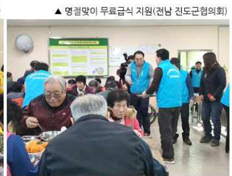
▲ 명절맞이 무료급식 지원(전남 진도군협의회)

대구 달성군협의회(회장 김상문)는 1월 4일 노인복지회관에서 여성복지분과위원, 무지개회원 등과 함께 정유년 첫 급식봉사를 실시했고, 충북 영동군협의회(회장 정원용)는 24일 북한이탈주민 가정을 찾아가 자문위원들이 직접 만든 설 명절 음식을 전달했으며, 전남 진도군협의회(회장 이기암)는 26일 장애인복지관에서 150여 명 장애우들에게 설맞이 무료급식을 지원했다.