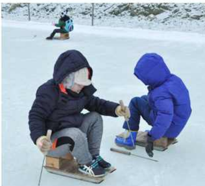
▲ 탈북청소년 문화체험(충남 예산군협의회)

전북 고창군협의회(회장 최석기)는 1월 15일 북한이탈주민들에게 성금을 전달하고 새해 맞이 행사를 열었으며, 전남 함평군협의회(회장 윤영수)는 25일 북한이탈주민들에게 정착지원금과 선물을 전달하는 시간을 가졌다.