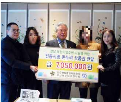
▲ 설날 북한이탈주민 위로품 전달 및 통일간담회 (부산 해운대구협의회)