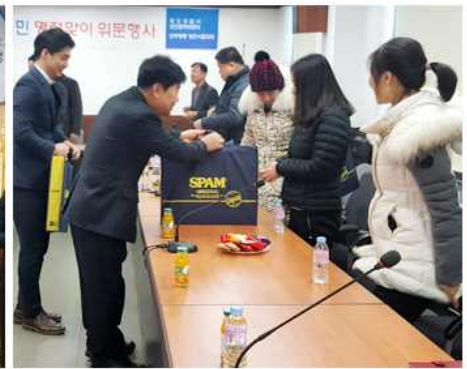
▲ 북한이탈주민 설명절 위문행사(충남 당진시협의회)

충북지역회의(부위원장 한상길)는 1월 22일부터 2일간 북한이탈주민협회(새삼인협회, 여명협회)를 찾아 북한이탈주민들에게 가래떡을 선물했고, 서울 마포구협의회(회장 김성우)는 24일 성금과 선물을 북한이탈주민들에게 전했으며, 충남 당진시협의회(회장 윤수일)는 24일 당진경찰서에서 보안협력위원회와 함께 지역 북한이탈주민을 초청해 명절맞이 위문품 전달식을 가졌다.