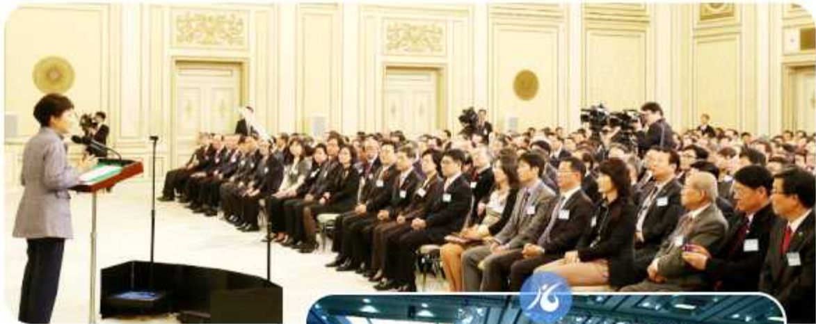
| 2013 운영·상임위원회 합동회의 및 대통령과의 대화(2013년 11월 25일)