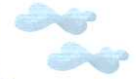
2014 한인 차세대 컨퍼런스 (2014년 11월 20~22일 / 캐나다 밴쿠버협의회)