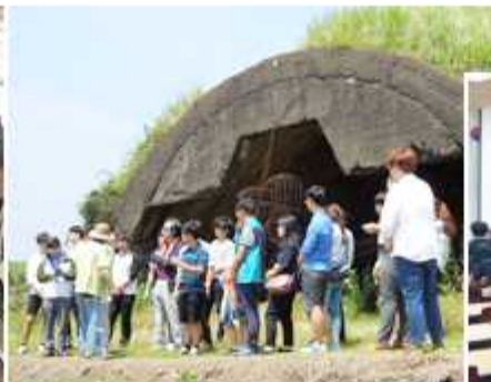
▲ 제주 지역회의