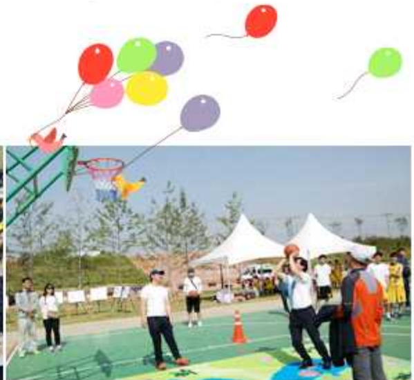
▲ 경북 구미시협의회