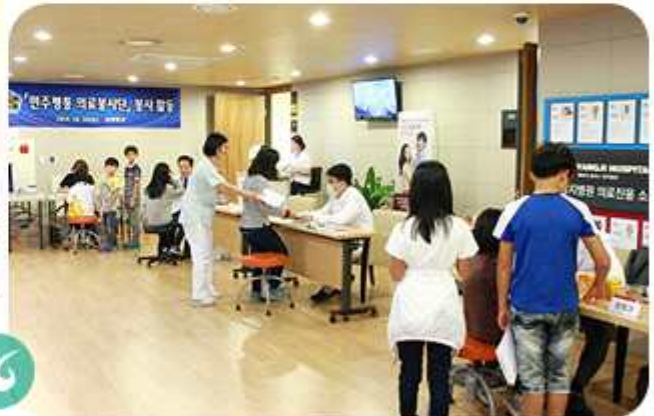
의료봉사단 제3차 무료건강검진(2014년 10월 10일) |