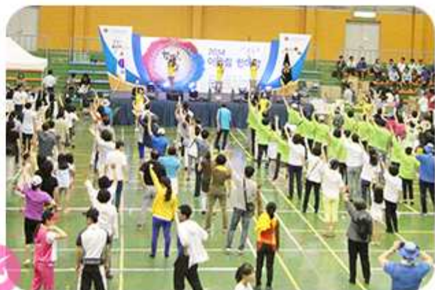
| 2014 평화통일 어울림 한마당(2014년 7월 19일 / 서울지역회의)