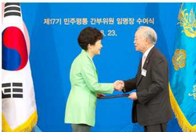
▲ 박근혜 대통령이 청와대에서 임명장을 수여하고 있다.

민주평화통일자문회의는 6월 23-24일 이틀간 서울 흥은동 소재 그랜드 힐튼호텔에서 ‘제17기 민주평통 국내 부의장·협의회장 합동회의’와 신임 간부위원 임명장 수여식을 개최했다. 이날 회의에는 현경대 수석부의장과 시도 부의장을 비롯해 운영 상임위원, 국내외 협의회장 등 300여 명이 참석했다.