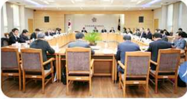
제7차 기획법제분과위원회(2014년 11월 3일)