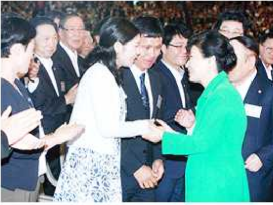
▲ 북한이탈주민 신혼부부와 악수하는 박 대통령

한편, 이날 행사에는 지난 6월 30일 광복 70주년 기념사업의 일환으로 민주평통 송파구협의회가 주관한 북한이탈주민 합동결혼식의 주인공인 80쌍의 신혼부부가 참석해 행사의 의미를 더했다. 이들은 박 대통령의 통일의지가 담긴 대회사에 큰 환호성으로 답했으며, 박 대통령 역시 직접 손을 잡고 격려할 만큼 각별한 관심을 보였다.