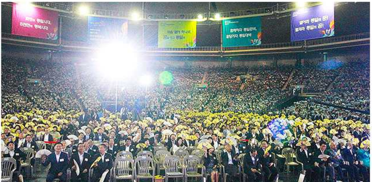
▲ 서로 다른 색의 부채를 손에 들고 통일외지를 다지고 있다.

곧바로 회의에 참석한 전원이 '통일은 대박이다'를 외치며 파도타기를 하는 퍼포먼스가 마련됐다. 행사 전에 지역별로 구분해 전달된 파랑, 노랑, 빨강, 초록의 서로 다른 색의 부채를 손에 든 자문위원들은 큰 함성으로 통일외지를 다졌다. 행사의 대미는 다문화가정의 아이들과 북한이탈청소년 등이 합창단원으로 활동 중인 와글와글 합창단, 아름드리 합창단, 통일하모니 등과 한 목소리로 부른 '우리의 소원'이 장식했다. 합창단원들은 물론 이날 행사에 참석한 전원이 손에 손을 마주 잡고 민족의 간절한 소망인 통일을 향한 진심 어린 바람을 전해 감동적인 분위기를 연출했다.