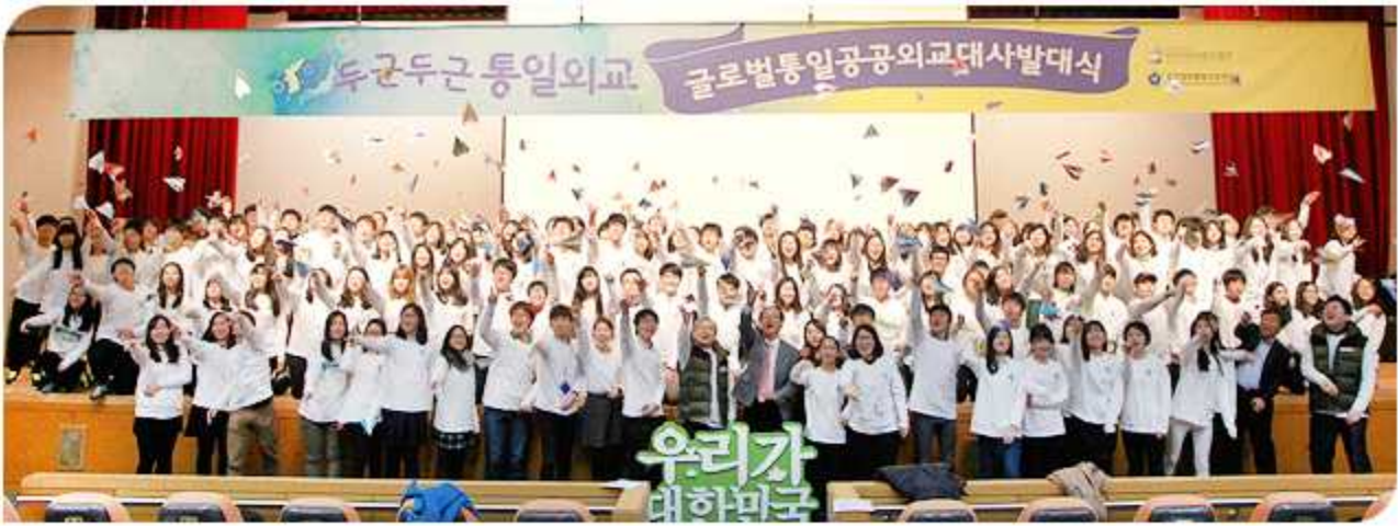
제1기 글로벌통일공공외교대사 발대식(2014년 12월 30일)