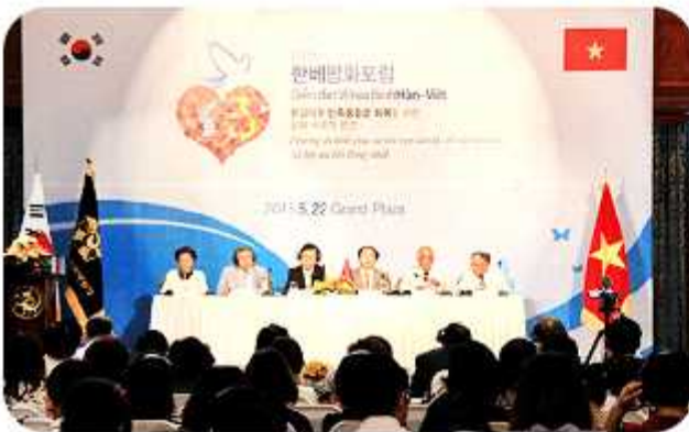
| 2015 한·베 평화통일포럼(2015년 5월 22일)