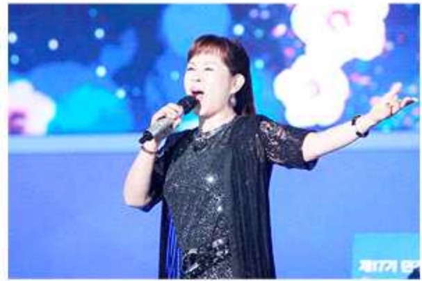
▼ 가수 이자연의 열창