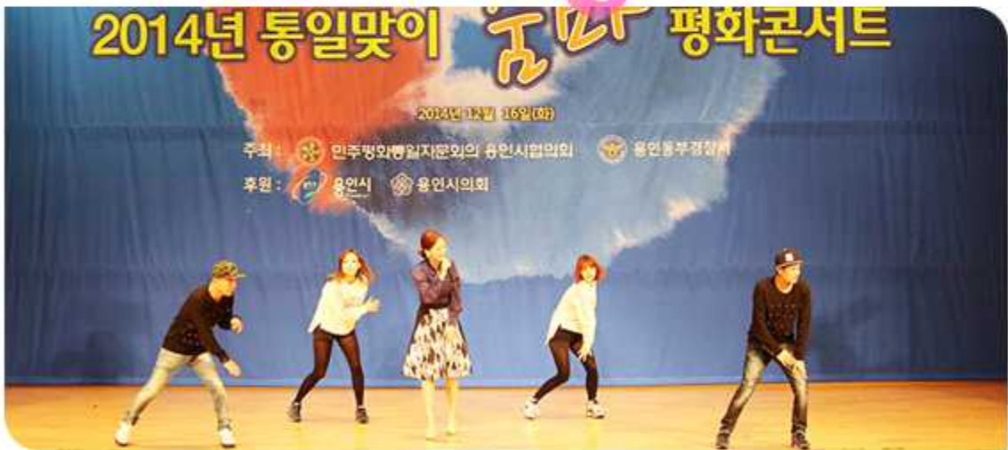
2014년 통일맞이 춤마 평화콘서트(2014년 12월 16일 / 경기 용인시협의회) |