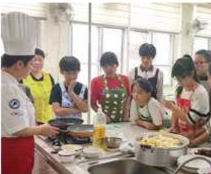
▲ 충남 청양군협의회

경기 구리시협의회(회장 김종태)는 16일 토평중학교 학생들을 대상으로 '청소년 찾아가는 통일교육'을 개최했으며 같은 날 전남 완도군협의회(회장 최번부)는 16일 완도수산고등학교 학생이 참석한 가운데 '통일안보 강연회'를 열었다. 경기 가평군협의회(회장 김기복)는 19일 호국 보호의 달을 맞아 '북한 바로알기'란 주제로 방일초등학교 학생들에게 '수준별 통일교육'을 실시했다.