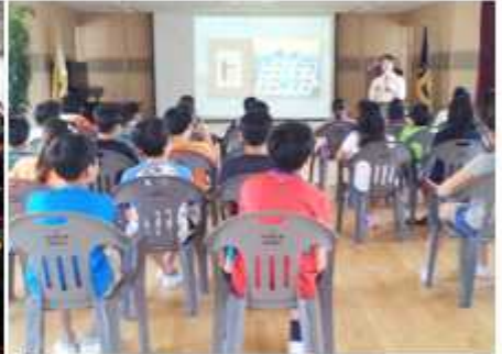
▲ 경기 가평군협의회

경기 구리시협의회(회장 김종태)는 16일 토평중학교 학생들을 대상으로 '청소년 찾아가는 통일교육'을 개최했으며 같은 날 전남 완도군협의회(회장 최번부)는 16일 완도수산고등학교 학생이 참석한 가운데 '통일안보 강연회'를 열었다. 경기 가평군협의회(회장 김기복)는 19일 호국 보호의 달을 맞아 '북한 바로알기'란 주제로 방일초등학교 학생들에게 '수준별 통일교육'을 실시했다.