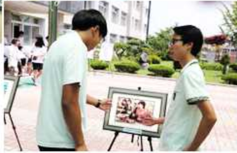
경기 여주시협의회 ▶