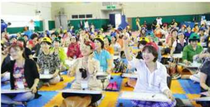
▲ 대구 동구협의회