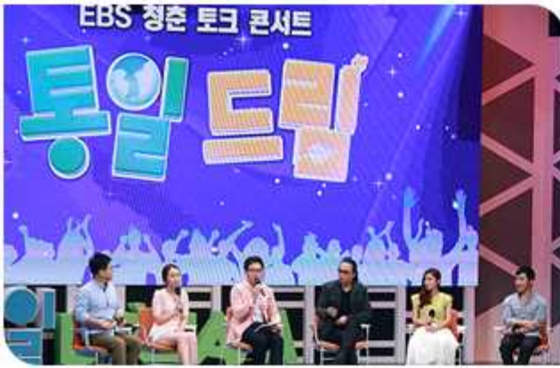
| 청춘 토크 콘서트 '통일드림' (2015년 9월 2일)