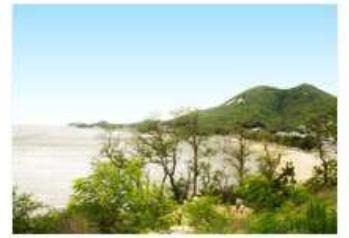
느낌 있는 여행 무작정 떠나고 싶거나 혹은 한없이 게을러지고 싶을 때 - 인천 강화도