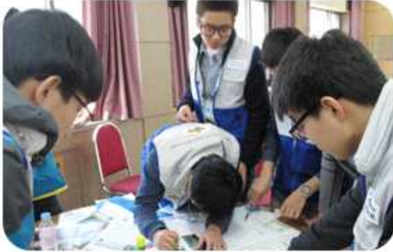
| 2014 청소년 통일리더십캠프(2014년 4월 4~5일 / 대구 중구협의회)