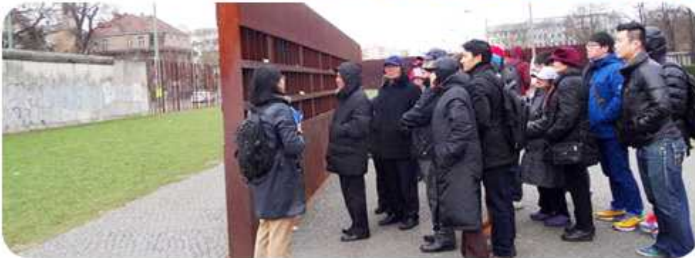
한반도 통일 기원 베를린장벽 길 걷기 운동 (2014년 12월 10일 / 북유럽협의회 베를린분회)