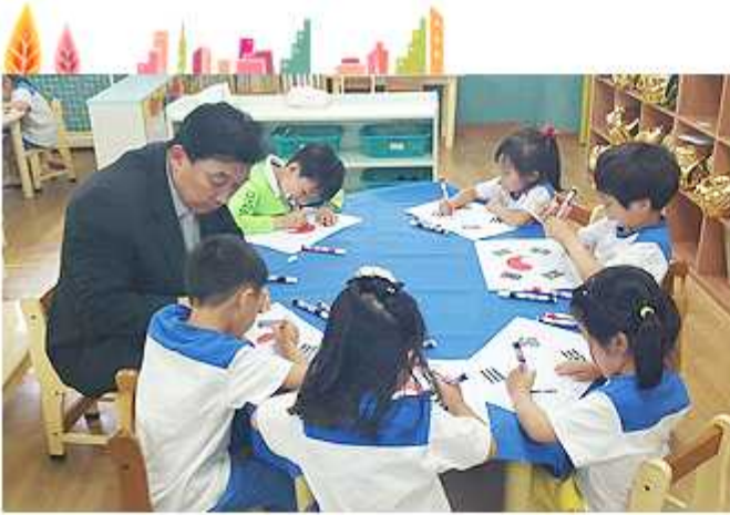
▲ 충북 괴산군협의회