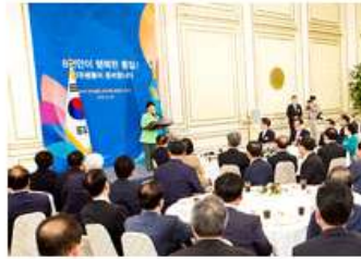
부의장·협의회장 합동회의 제17기 국내 부의장·협의회장 합동회의 개최