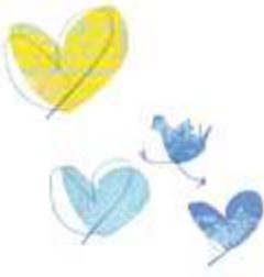
어깨동무하기 멘토 아카데미 (2014년 4월 24~25일)