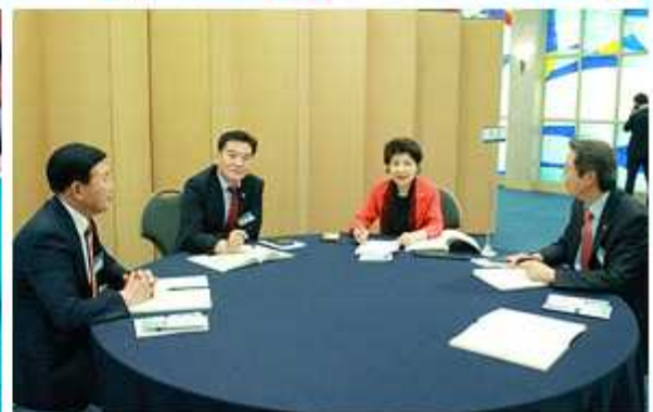
▲ 지역별 오리엔테이션