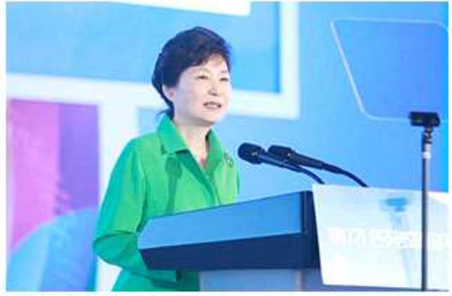
▲ 의장 박근혜 대통령의 대회사

또한, 박 대통령은 "우리 정부는 남북한의 모든 현안을 테이블에 올려놓고 허심탄회하게 대화를 나눌 준비가 되어 있지만, 북한이 호응해 오지 않고 있다."고 안타까움을 표하며, "북한도 이제 용기 있게 대화의 장으로 나와 남북한 모두를 위한 최선의 길을 함께 찾아 나가야 할 것"이라고 말했다. 특히 "북한이 핵을 포기하는 결단을 내린다면, '경제와 평화', '체제안정과 경제발전' 모두를 얻을 수 있고, 우리 정부는 북한의 핵 포기 과정에서 함께 추진할 수 있는 다양한 경제협력 사업을 강구하고 있다"고 말하며, 핵이 체제를 지킬 것이라는 미망을 버리고, 국제사회의 일원으로 복귀해 함께 평화통일에 대해 논의할 것을 촉구했다.