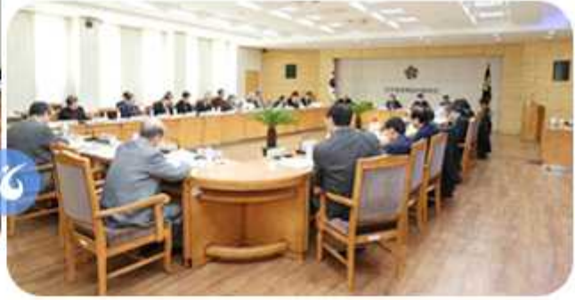
제8차 통일교육위원회(2015년 2월 27일)