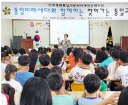
▲ 경북 예천군협의회