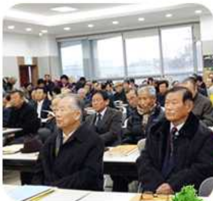
| 경북 칠곡군협의회 (2014년 12월 3일)