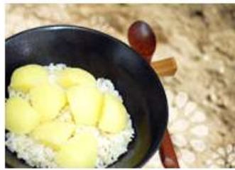
통일 레시피 무더운 여름철 별미 함경도 감자밥