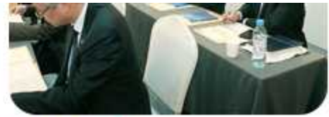
| 2014년도 제6차 직능별 정책회의(2014년 11월 4~5일)