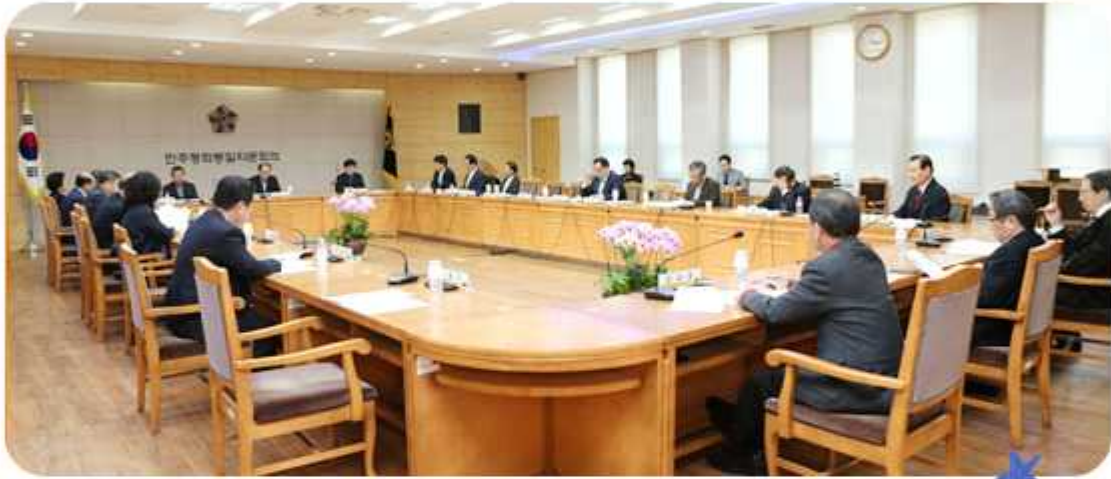
제9차 정치안보국제분과위원회(2015년 4월 17일)