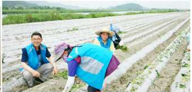
▲ 전남 해남군협의회