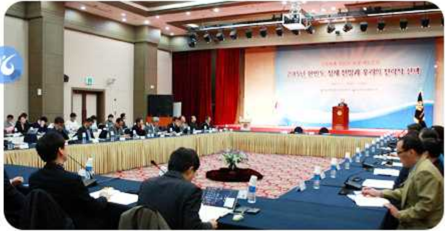
제13차 남북관계 전문가대토론회 (2014년 11월 14일)