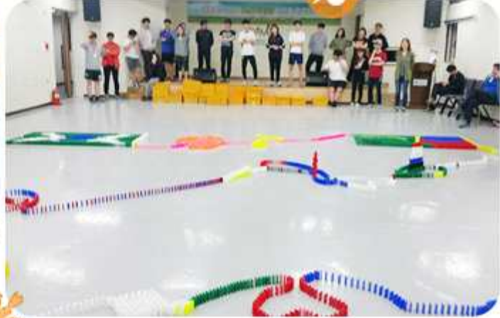
| 전북대학교 통일 동아리 DMZ 캠프(2015년 5월 16일 / 전북 지역회의)