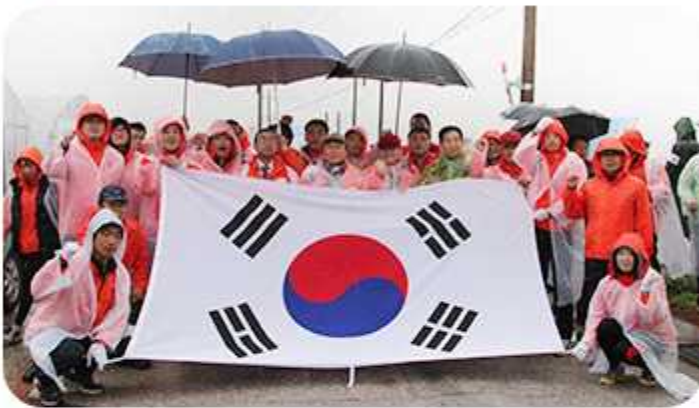
2030청년지문위원 DMZ 평화통일 한마음축제-걷기대회 (2013년 11월 1~2일)