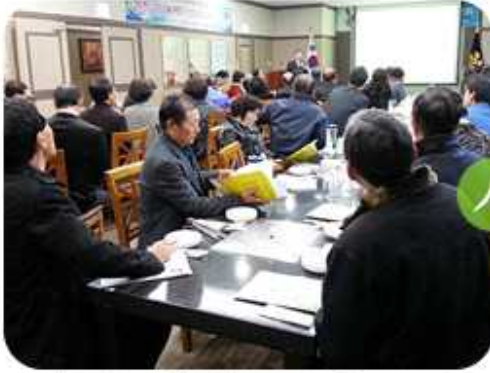
제주 서귀포시협의회(2014년 12월 26~27일)