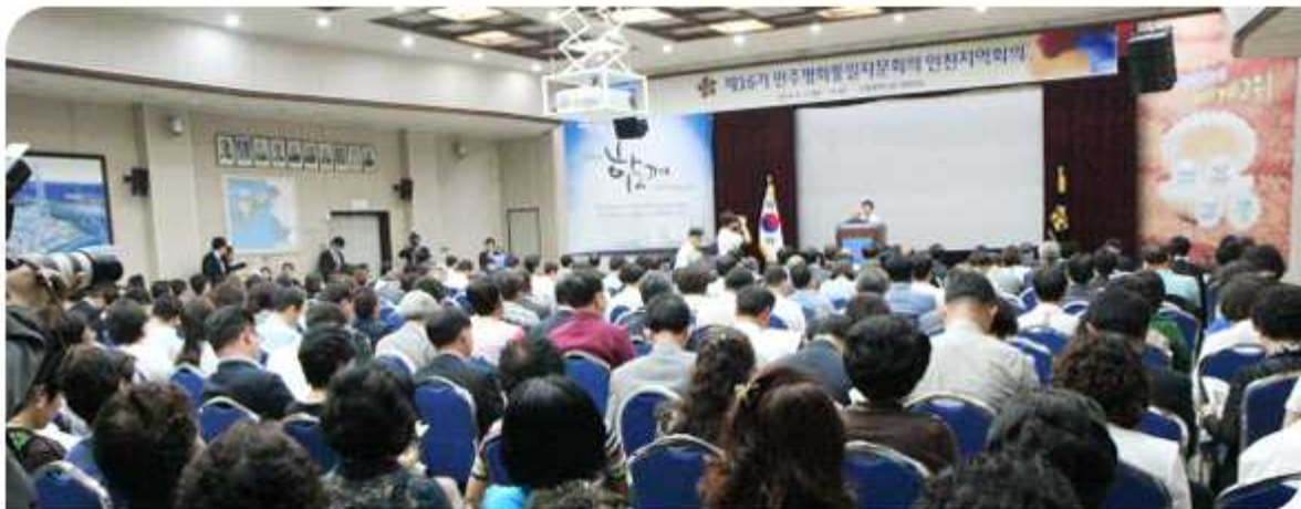
| 제16기 인천지역회의(2014년 6월 17일)