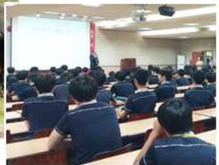
▼ 경기 화성시협의회