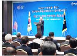
해외간부위원 워크숍 통일 열망 안고 지구 반대편에서 날아오다