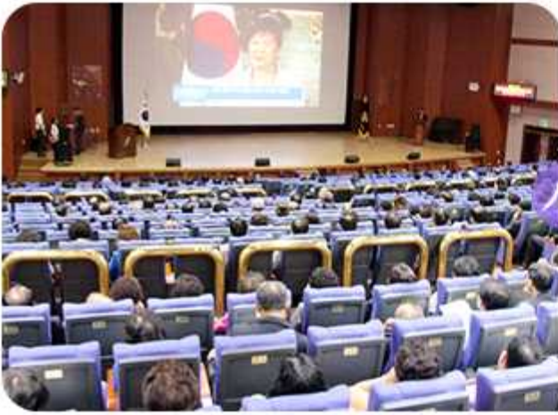
| 제16기 전북지역회의(2014년 6월 17일)