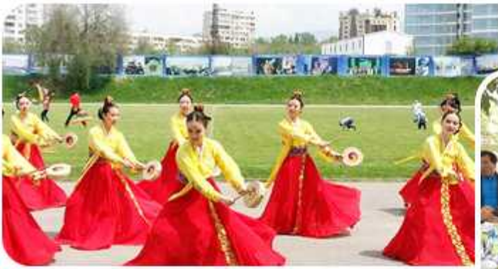
| 유라시아대륙 한민족 축제(2015년 5월 2일, 중앙아시아협의회)

통일 시화전 및 통일 글짓기 대회 (2014년 3월 1~15일 / 아프리카협의회)