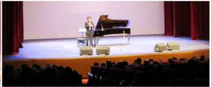
▲ 대구 달서구협의회

서울 성북구협의회(회장 이상호)는 4일 '광복, 전쟁, 분단 그리고 오늘'이라는 주제로 '광복 70주년 기념 성북구 평화통일 예술제'를 개최했으며 대구 달서구협의회(회장 손철수)는 9일 광복70주년 기념 '2015 달서구민과 함께하는 통일음악회'를 열었다.