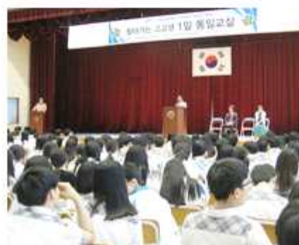
▲ 경기 김포시협의회

경기 김포시협의회(회장 조진남)는 3일 운양고등학교 학생을 대상으로 '고교생 1일 통일교실'을 개최했으며 경기 동두천시협의회(회장 안민규)는 4일 신흥중학교 학생, 교사와 함께 제3차 '2015년 찾아가는 청소년 통일 이야기' 행사를 가졌다.