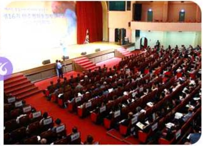
| 제16기 서울지역회의(2014년 6월 24일)