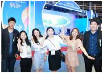
대학생기자단 출범회의 동행기 민주평통 대학생기자단 출범회의 가다!