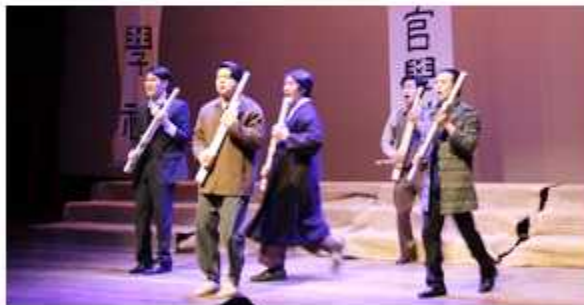
▲ 서울 성북구협의회