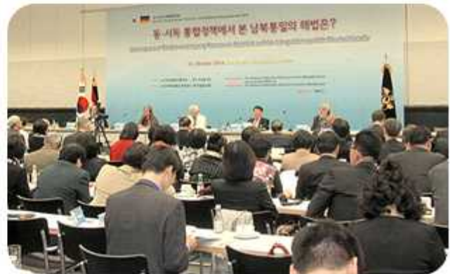
| 2014 한·독 평화통일포럼(2014년 10월 15일)