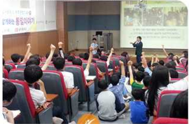
| 탈북청소년과 함께 하는 통일이야기 (2015년 5월 27일 / 전북 완주군협의회)