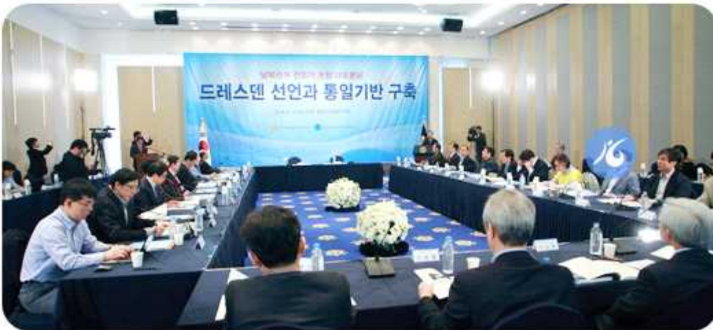
제12차 남북관계 전문가 초청 대토론회(2014년 4월 11~12일)