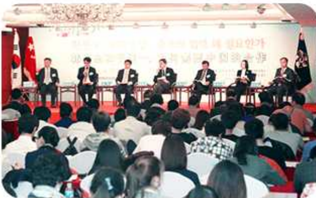
| 2015 한·중 평화통일 포럼(2015년 4월 22일)