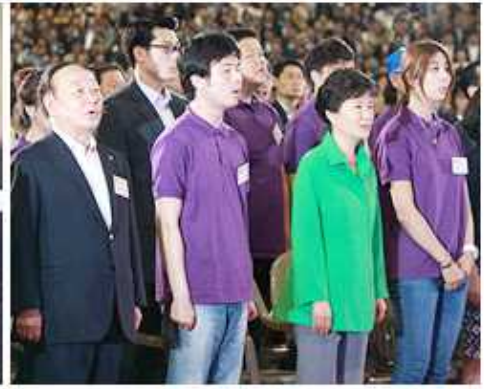
▲ 애국가 제창