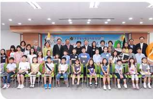
| 북녘친구에게 보내는 초등학생 편지쓰기대회 시상식 (2014년 8월 19일)