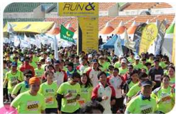
제15회 통일기원 포항해변마라톤대회 (2014년 4월 26일 / 경북 포항시협의회)