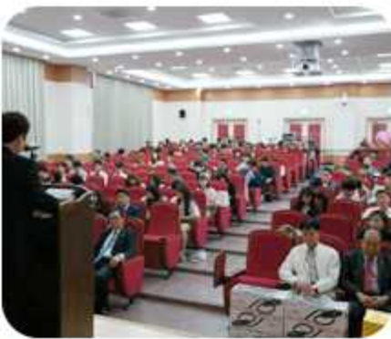
| 2015 강원 청년 통일 TALK (2015년 4월 30일)