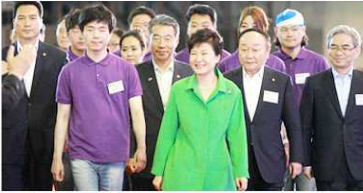
▲ 밝은 미소로 입장중인 박근혜 대통령