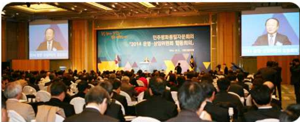
| 2014 운영·상임위원회 합동회의(2014년 12월 4일)