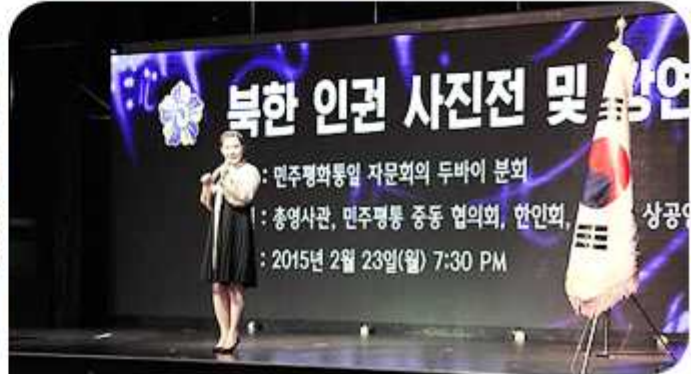
| 북한인권 사진전·강연회(2015년 2월 6~7일 / 중동협의회)