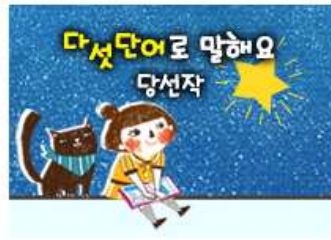
이벤트 당선작 다섯단어로 말해요