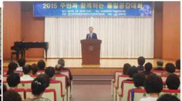
▲ 부산 연제구협의회

충남 천안시협의회(회장 김승태)는 6월 1일 천안시 공무원을 대상으로 '평화통일염원 및 시민안보의식 고취를 위한 특별강연'을 개최했다. 부산 연제구협의회(회장 이주환)는 4일 대항기관장 등 주요인사, 시민들을 대상으로 '2015 주민과 함께하는 통일공감대화'를 열었다.