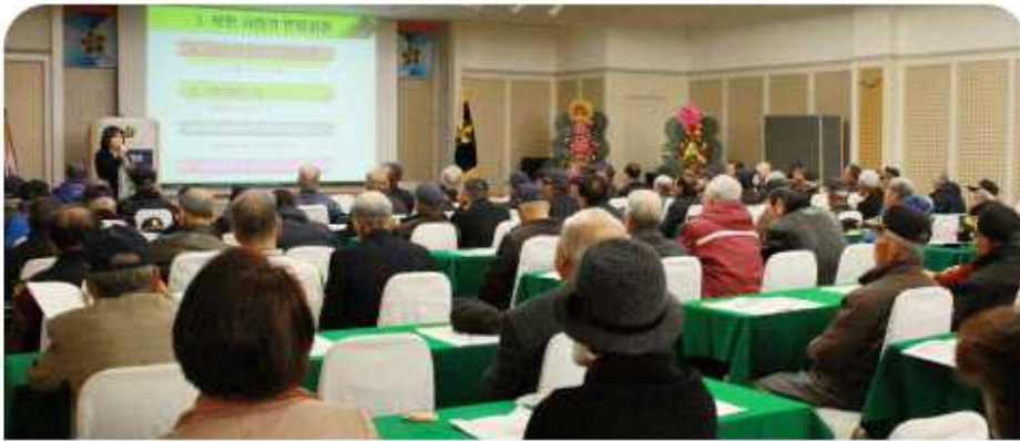
충남 아산시협의회 (2014년 11월 19일)