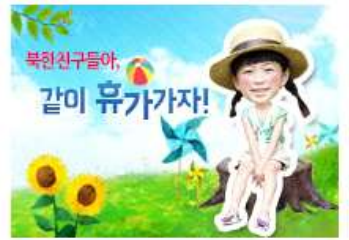
이벤트 북한친구들아, 같이 휴가가자!