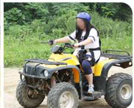
| 통일맞이 하나-다섯운동 '어깨동무하기 방학캠프'(2014년 8월 13일 / 검가지역회의)