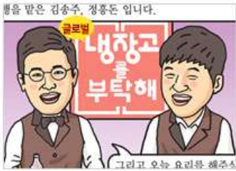
통일 웹툰 통일한국 전통 장으로 글로벌 냉장고를 부탁해요~.