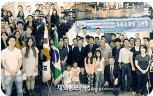
| 차세대 통일 강연회(2015년 2월 6~7일 / 브라질협의회)