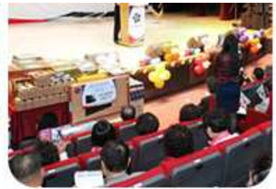
| 광복70주년 통일을 노래하다 '통일송 개사 경연대회' (2015년 4월 28일 / 대전지역회의)