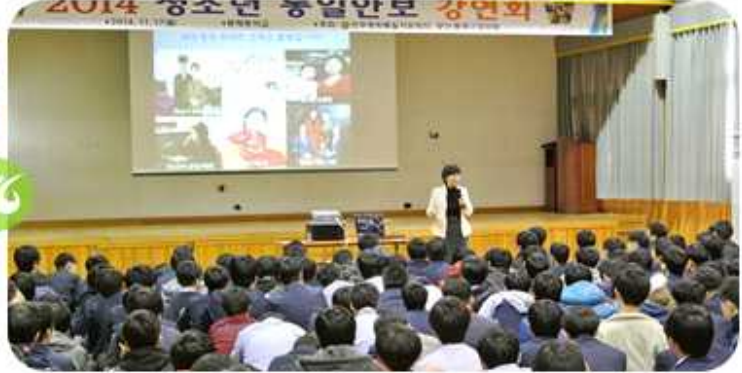
부산 동래구협의회(2014년 11월 17일)