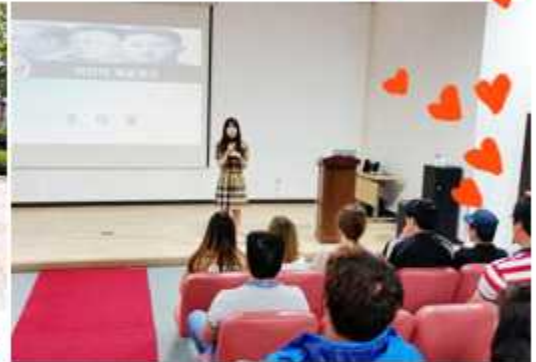
경남 창원시협의회 ▶