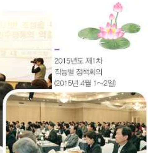
2015년도 제1차 직능별 정책회의 (2015년 4월 1~2일)