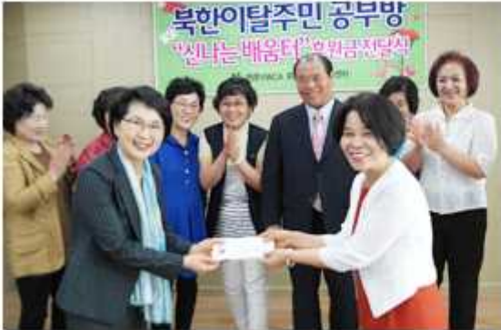
▲ 전북 지역회의