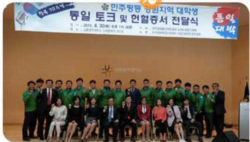
| 2015 강원 청년 통일 TALK(2015년 4월 30일)