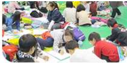
| 통일된 대한민국을 염원하는 평화통일 그림그리기 (2014년 10월 28일 / 충북 옥천군협의회)