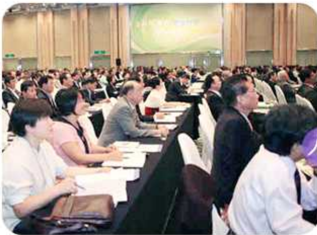
| 제16기 해외지역회의-3차(2014년 9월 1~4일)