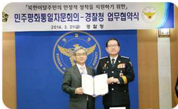
| 경찰청-민주평통, 북한이탈주민 정착지원을 위한 MOU 체결 (2014년 3월 21일)