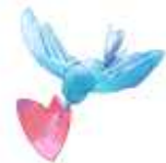
KBS 역사통일 골든벨 (2014년 7월 20일)