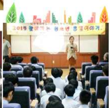
▲ 경기 동두천시협의회