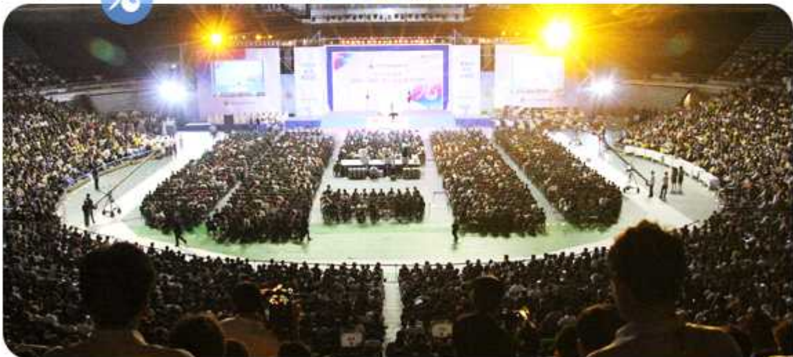
| 제16기 민주평통 전체회의의 전경(2013년 8월 28일)