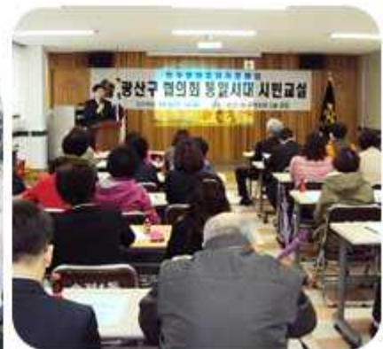
| 광주 광산구협의회 (2015년 3월 18일)