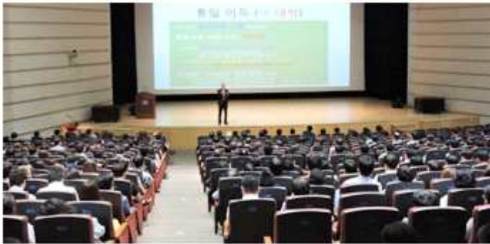
▲ 충남 천안시협의회