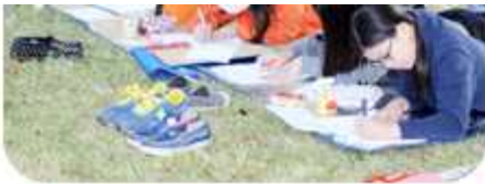
| 2014 청소년 통일백일장 글짓기 대회 (2014년 10월 9일 / 경기 양주시협의회)