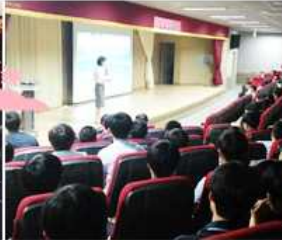
▲ 전남 완도군협의회