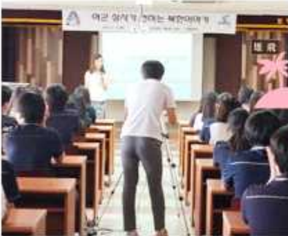
▲ 경기 구리시협의회